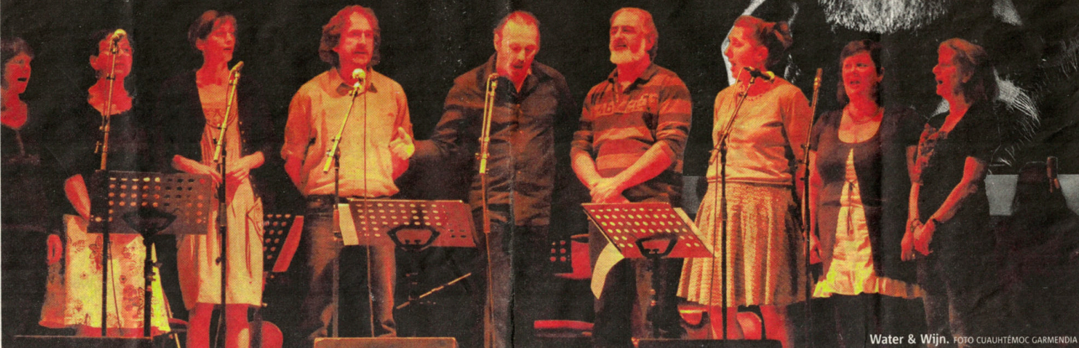
Water & Wijn.